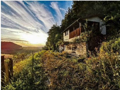
Rebhüsli Hintererli