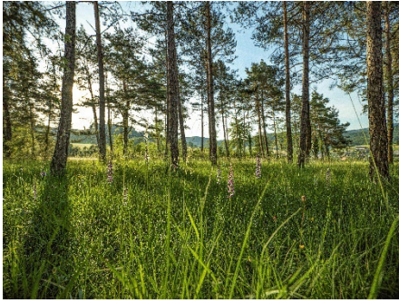
Den lichten Föhrenwald auf dem Flower Walk entdecken