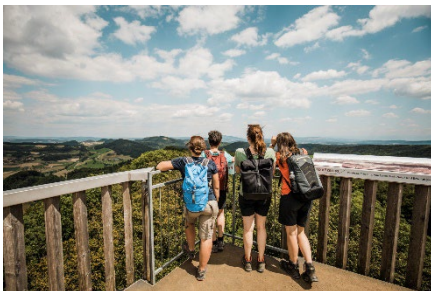
Aussicht vom Cheisacherturm am Fricktaler Höhenweg