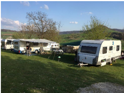
Camping Waldesruh in Wil AG